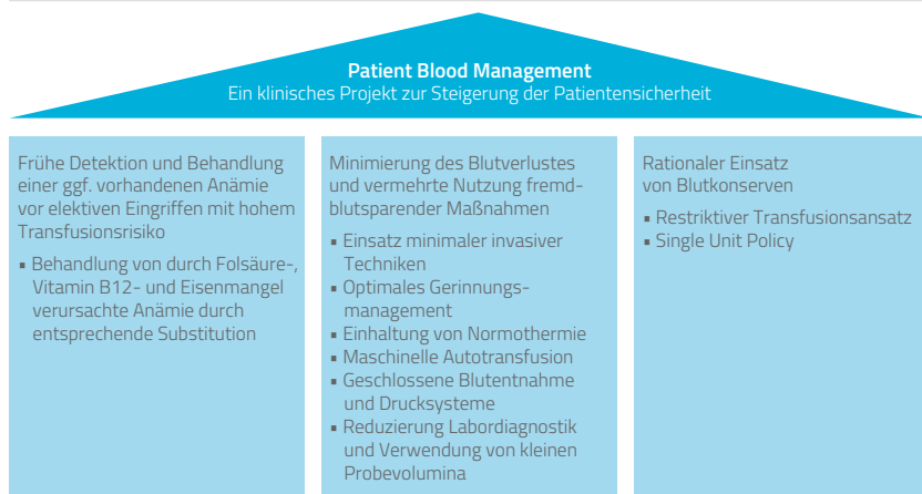
Abbildung 1: Drei-Säulen-Konzept von Patient Blood Management