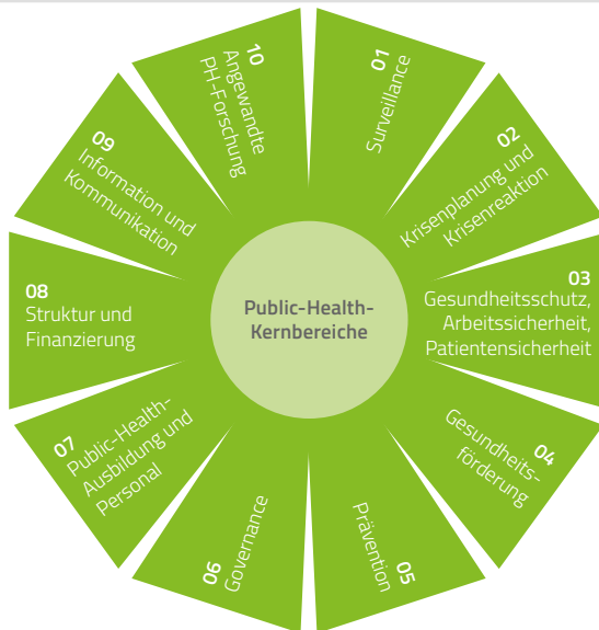
Abbildung 2: Kernbereiche von Public Health